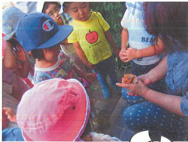
ハムスターを囲んで... 「小さいね」「フワフワ~」