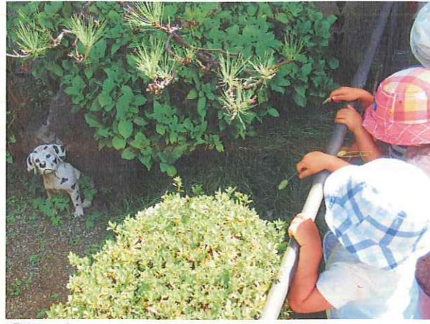
「あっちに ワンちゃん おるよ!」