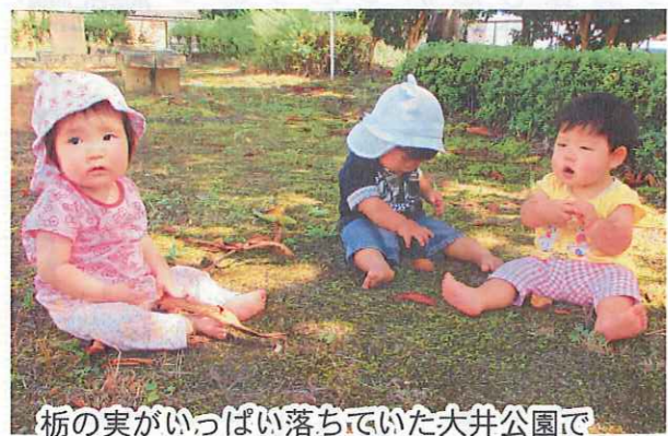
栃の実がいっぱい落ちていた大井公園で大きな葉っぱ、殻、実で遊んだよ