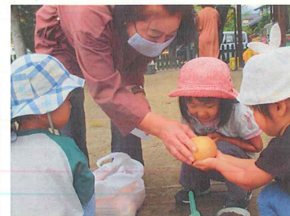
「梨持って来たよ。持ってみる？」 「わあ、大きい!」