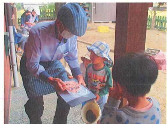
「あ!お肉屋さん来たよ」「それ、なあに」 「今日は豚肉だよ」