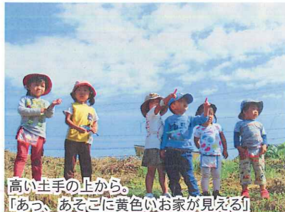
高い土手の上から。 「あつ、あそこに黄色いお家が見える」 「お山も見えるよ」