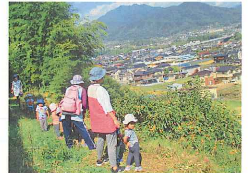
はじめて段丘に行ってきました