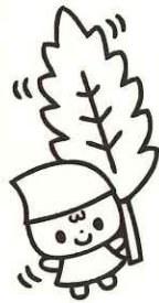
「だるまちゃん、ミカンのにおいがする葉っぱだよ」