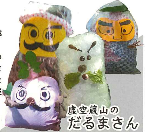
虚空蔵山の だるまさん

つくし組、たんぼ組も山のお土産をもらって、特別な事が分かって喜びも大きかったです。