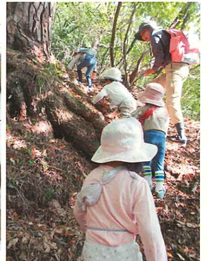
なぎ登りも果敢に挑戦する かっぱ組