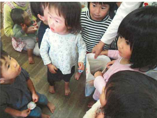
たんぼぼさん お守りありがとうとお土産を届けてくれました。つくし組もお土産をもらいました。とっても喜ぶたんぼぼ組。お家の方にも、山のお土産渡しました。