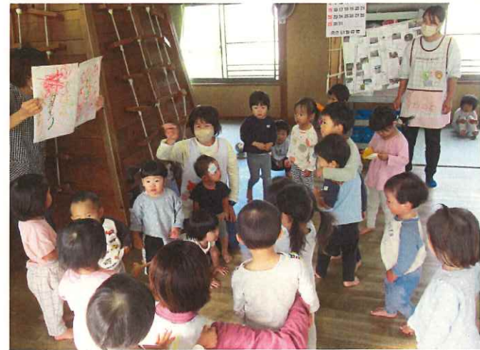
たんぼ組からひまわり、かっぱさんへ山登りのお守り。 さあ、これから虚空蔵山に出発。