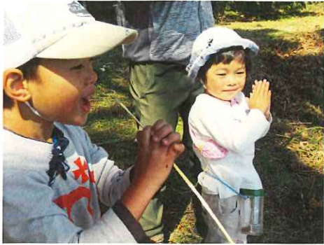
草ラップを使ってひまわりさんを呼ぼう