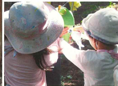
やっと会えたんね やっポーちゃん