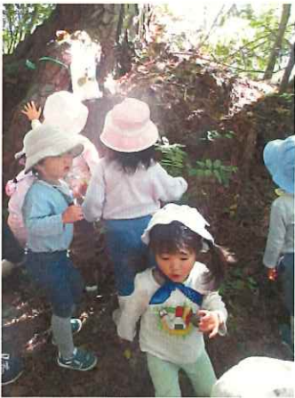
ひまわり組 だるまちゃん見つけた