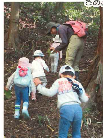
ラストの登り。「光が見えてきたから、もうちょっとだよ」