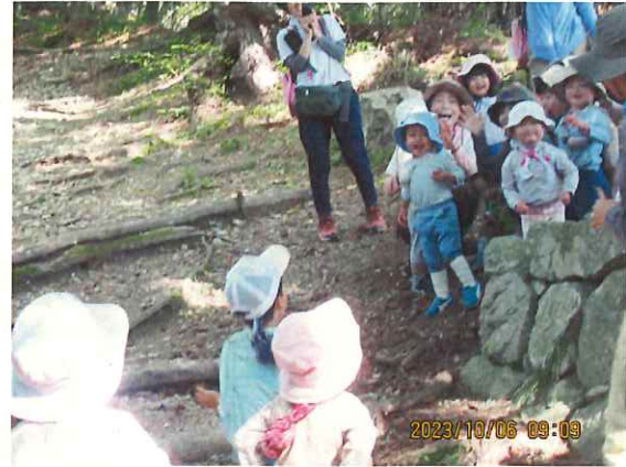
かっぱさん! せーの ばあ! (先に登り始めていたひまわり組にかっぱ組が追いついて)