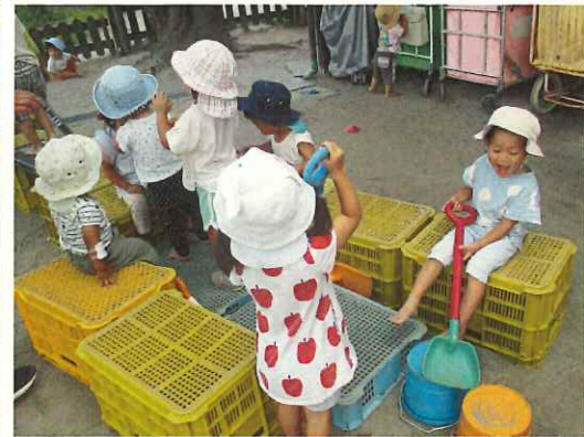
コンテナの珍しいお家ができていると、どんどん子ども達が集まって楽しそう。そこに3歳児のEちゃん、Tちゃんがコンテナのお盆にご飯をのせて2人で「みんな～ごはんですよ～」と持って来てくれました。それも嬉しくて早速いただいていたました。